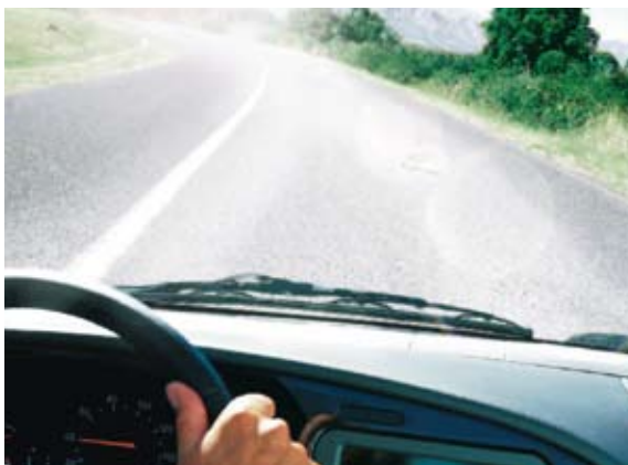
Visione senza le lenti polarizzate.

La lente polarizzata ha lo scopo di filtrare la luce riflessa in un'unica direzione eliminando , quindi, i riflessi provenienti da: asfalto, acqua, neve, sabbia, cofano dell'auto e dalle altre superfici orizzontali.