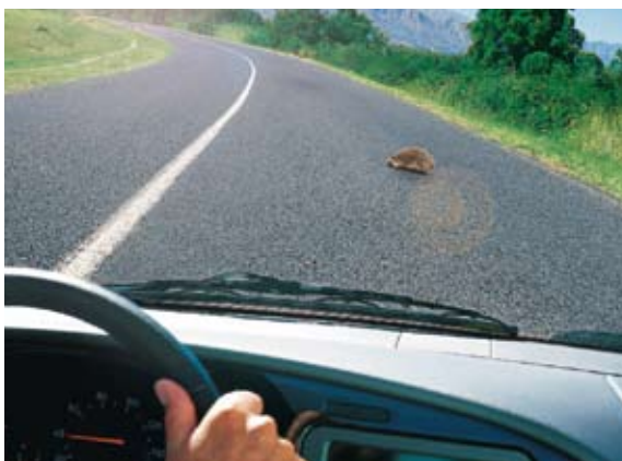
Visione con le lenti polarizzate. Le lenti polarizzate eliminano i riflessi che rendono la visione poco nitida.